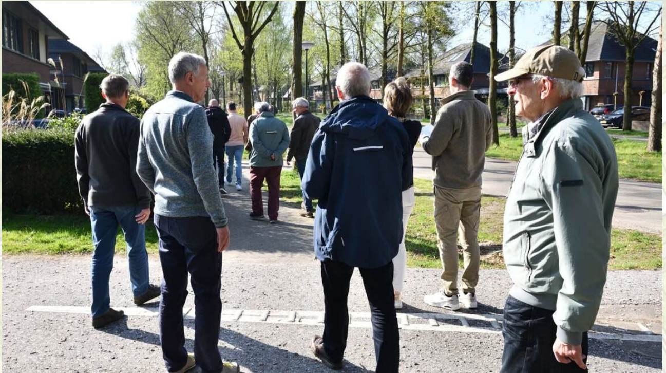
Wijkwandeling oktober 2025