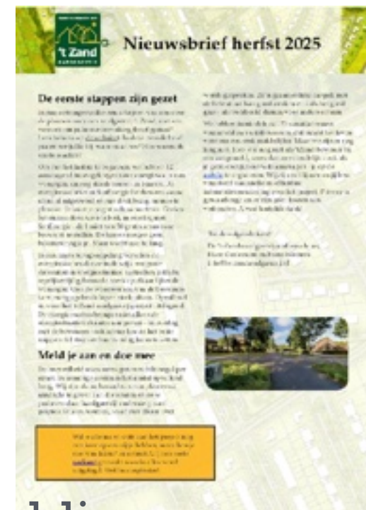
Publiceren nieuwsbrief 4x per jaar (digitaal en huis-aan-huis)