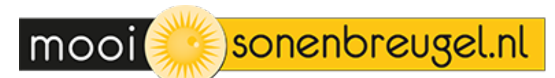
Publicaties in MooiSonenBreugelkrant