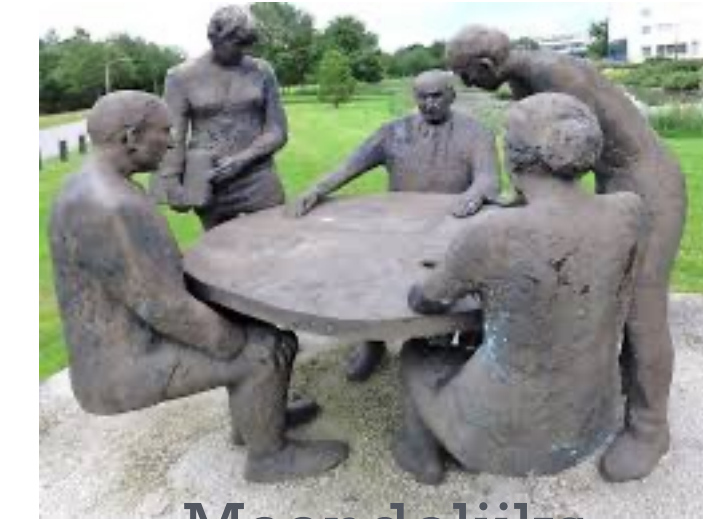
Maandelijks overleg met gemeente

Samenwerking met SonEnergie, o.a. energiescan en Dag van het klimaat