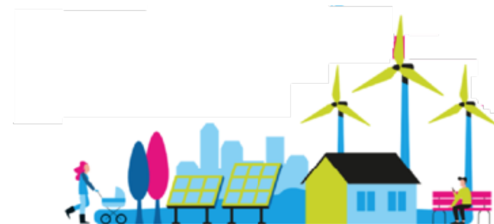
Meegedacht over nieuw warmteplan