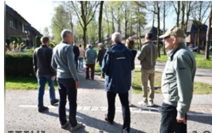
Wijkwandeling op 12 april en 25 oktober 2025